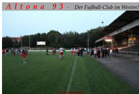
Nach dem Spiel gegen den SV Lurup am 24.8.2012

2 Es wurde im Juni des Jahres 2007 von Altona 93 mit dem ALTONAER SPAR- UND BAUVEREIN und der BEHRENDT WOHNUNGSBAU KG ein Kaufvertrag mit aufschiebender Wirkung (bis spätestens 2030) für das Gelände der heutigen Adolf-Jäger Kampfbahn abgeschlossen. In 2011 wurde gemäß erneutem Beschluss der Mitgliederversammlung der Vertrag dahingehend verändert, dass die erste Kaufpreirate (zur Begleichung von „Altlasten“ in Form von Sozialabgaben u.a. aus der Regionalligasaison 2008/09) fällig wurde und der Punkt „Stadion“ als Voraussetzung als eine Voraussetzung zur Erfüllung des Kaufvertrages herausgenommen wurde. Der Alternativvorschlag der Fanabteilung fand damals leider keine Mehrheit. Damit ist nun final nach übereinstimmender Rechtsauffas-