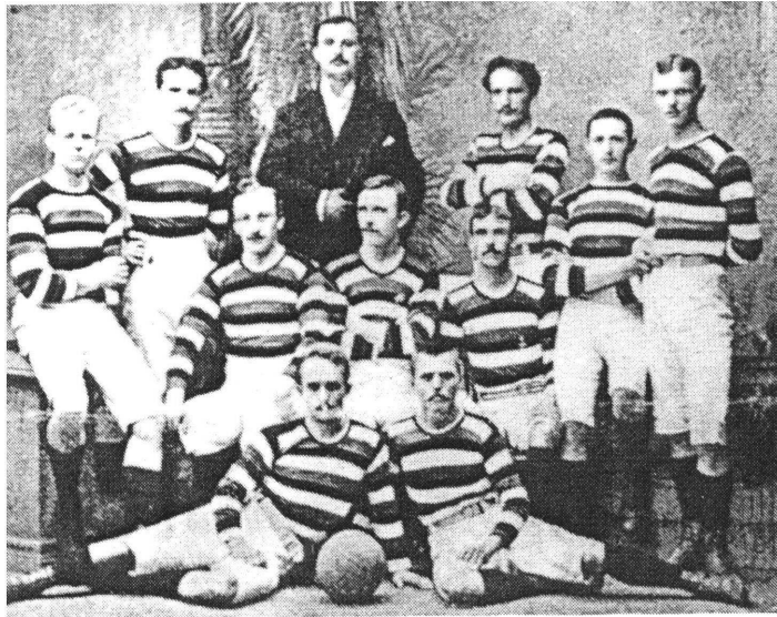
Hamburger Meister 1898